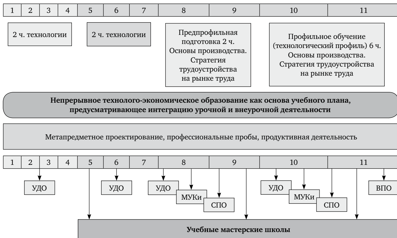
Рис. 4. Организационная модель профориентационной работы на основе непрерывного технологическо-экономического образования школьников

отношения к профессиям, видам профессиональной деятельности определяет важность в системе общего образования всех предметов БУП, в особенности предметных областей «Технология» и «Экономика».