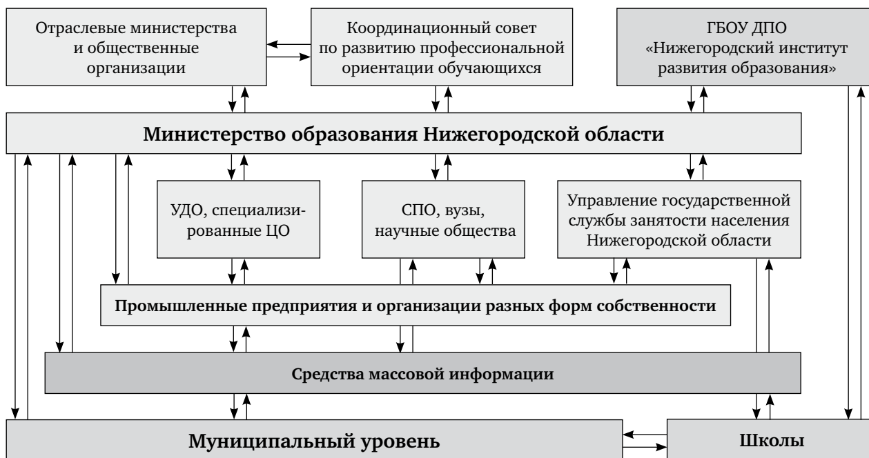
Рис. 1. Взаимосвязи в системе субъектов профориентационной работы в Нижегородской области на региональном уровне

гарантированного минимума профориентационных образовательных услуг, способствующих устойчивой мотивации обучающихся к обоснованному профессиональному самоопределению.